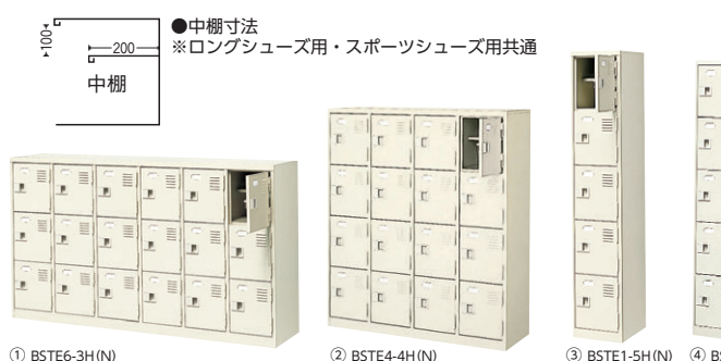
① BSTE6-3H(N) ② BSTE4-4H(N) ③ BSTE1-5H(N) ④ BSTE3-5H(N) ⑤ BSTE4-5H(N) ⑥ BSTE1-6H(N) ⑦ BSTE5-6H(N)