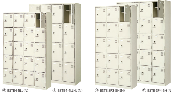
⑧ BSTE4-5LL(N) ⑨ BSTE4-4LLHL(N) ⑩ BSTE-SP3-5H(N) ⑪ BSTE-SP4-5H(N)

●ロングシューズ用・中棚付(3段・5段ボックス内寸/W230×D330×H290・中棚/D200) (4段ボックス内寸/W245×D360×H388・中棚/D200)